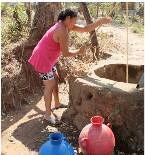
Emakume bat, putzu batetik ura ateratzen

lean kutsadura dakarte, bai eta lurpeko urena ere, lixibiatuak iragazteagatik. Horrek guztiak osasun arrisku handia dakar, eta pertsoneri ez ezik, inguruneke faunari eta florari ere eragiten die. El Salvadorreko Ingurumen eta Baliabide Naturalen Ministerioak berriki egindako azterlan batzuen arabera, herrialdeko ibaien % 38k kalitate kaskarreko edo oso txarreko ura dute, eta % 50ek erdipurdiko kalitateko ura. Ur osasungaitza kontsumitzea, zikinkeria, kiratsak eta intsektuak ditugu, zehazki, herritarrek gaixotasun gehiago izateko arriskua eragiten duten faktoreak. Beherakoa eta gastroenteritisa dira gaixotasunik ohikoena; batez ere, 5 urtez azpiko haurrei eragiten die, eta landa eremu horretan, mediku arreta egokirik gabe, heriotza ere ekar dezakete.