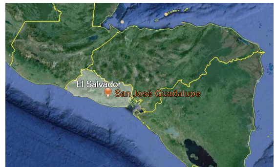
San Jose Guadalupe El Salvadorreko erdigune menditsuan dago kokatuta

Etxebizitzaren % 55etan energia elektrikoa dute; izan hornidura sarekoa, izan eguzki plaken bidezkoa. Etxebizitzak material landugabez daude eraikituta: hormak kanabera edo lastozkoak dira, lokatzarekin nahastuta; etxebizitzetako lurzorua, berriz, zapaldutako lurra baino ez da.