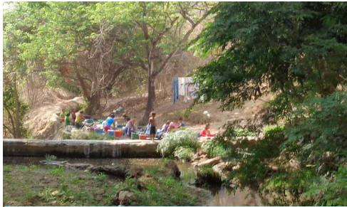
Ibaian nork bere burua eta arropa garbitzea ohiko jarduera da

Baina bada komunitate honek urarekin lotuta daukan beste arazo orokor bat ere: uraren kutsadura , hain zuzen. Aire zaba-