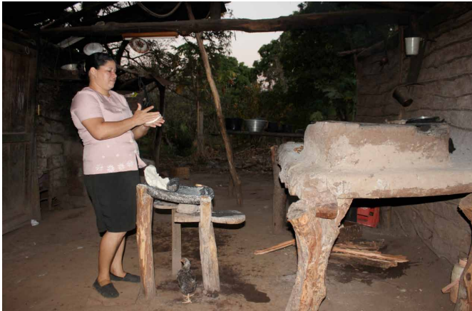
Emakume bat, bere etxebizitzan bazkaria prestatzen

Emakumeek gizonek baino lehenago utzi behar izaten dituzte ikasketak, etxeko eta landako lanetan laguntzeko. Baliabide ekonomiko eta antolamenduzkoak eskuratzeko, bai eta euren premiekin eta interesekin lotuta dauden erabakiak hartzeko parte-hartzean ere, diskriminazio baldintzak pairatzen dituzte. Oro har, aitak jokutzen du familiaburu rola, eta hark hartzen ditu familiari eragiten dioten erabaki garrantzitsuenak; huraxe da komunitateko gaietan bozkatzen duen bakarra. Horri guztiari herrialde osoan orokorrean dagoen genero indarkeria maila handia gehitu behar zaio. 2013. urtean, 12 emakume hil zituzten 100.000 biztanleko.