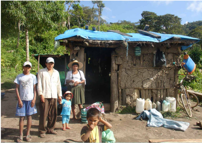
Valles Cruceños eskualdeko familia bat

zoak lantzeko, guztien artean gizarte eta ekoizpen garapeneko proposamenak egite aldera. OLE bakoitzak zuzendaritza bat izendatzen du eta horrek jardun behar du komunitatearen eta tokiko gobernuaren arteko bitartekari gisa, eskaerak eta proposamenak helarazteko eta udal aurrekontuko funtsak eskuratu ahal izateko. Gainera, gai zehatzagoekin lotutako beste erakunde batzuk ere badaude; hala nola, Ura Administrazio Erakunde (UAE) . Azken hori da komunitate bakoitzak duen uraren eskuratzea, erabilera eta banaketa kudeatzeaz arduratzen dena. OLEk bezala, erakunde honek ere zuzendaritza batzorde bat dauka, bozketaz hautatua. Praktikan, zuzendaritza hori ez da gai zuzen kudeatzeko lurraldeko iturburuak eta ur iturriak, ezta biztanleriari ura zuzen, eraginkortasunez eta etengabe banatuko zaiola bermatzeko ere. Izan ere, ez dituzte ezagutza tekniko nahikoak eta ez dago kudeaketa tresna nahikorik (estatutuak eta araudiak, plan eragileak...). Era berean, ez dute daturik isurialdeetako uraren kantitateari eta kalitateari buruz, uraren ahalari eta erabili ahal duten mailari buruz. Hain zuzen, alderdi horiek beharrezkoak dira plangintza eta aprobetxamendu iraunkorra diseinatzeko. Azken finean, OLEak eta UAEak ez dira oso eragileak eta eraginkorrak beren lanean.