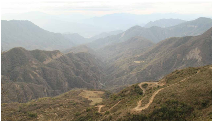
Valles Cruceños eskualdeko erliebe menditsua

Valles Cruceños eskualdeko gizartearen beste ahultasun handi bat da emakumeen marjinazioa , dela familia mailan, dela komunitate eta udal mailan. Emakumeen hezkuntza maila baxuagoa da gizonen dutenarekin alderatuta, eta etxea eta seme-alabak zaintzen jardun ohi dira, baztertuta. Landako lanetan parte hartzen dute, baina gizonen maneiatzen dituzte irabazkiak eta hartzen dituzte erabakiak familiako ekonomiari buruz. Komunitateko biltzarretan emakumeek duten parte hartzea entzutera mugatzen da, haien iritziak nekez baloratzen baitira. Bozketetan, gizonen botoak kontatzen du, etxeko burutzat hartzen baita, eta, beraz, familia osoaren ordezkaritza.