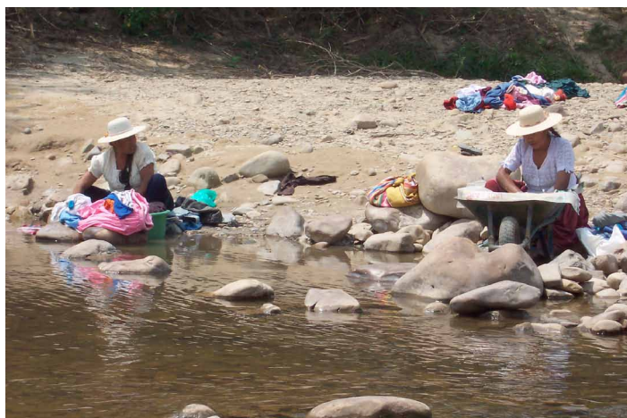
Emakumeak ibaian arropa garbitzen

Biztanleak gutxinaka-gutxinaka jabetzen doazen arren bere ongizaterako eta etorkizuneko belaunaldietarako ingurumen osasuntsua eta zaindua izatearen garrantziaz eta onurez, garrantzia gutxiko gaia dela uste da oraindik, eta agintarien eskutik ez dago benetako konpromisorik pertsonen inguruarekin duten jokabidea arautzeko araurik egiteko.