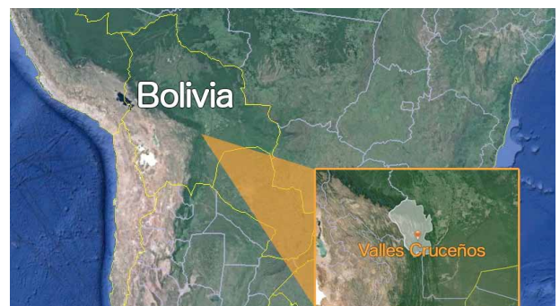
Valles Cruceños eskualdearen kokapena, Andeak mendikatearen inguruetan

Mediku zentroa komunitate handienetan soilik dago (500 familia edo gehiago dituztenetan); gainerakoetan, aldiz, oinarriko botika