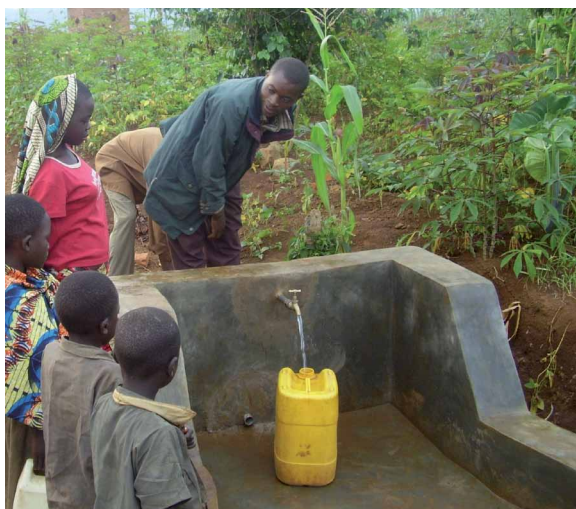
Iturri publiko bakoitzak hainbat familia hornitzen ditu