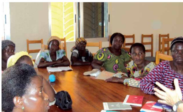
Ezagutza berriek beren bizitza eta euren familien bizitza hobetzen laguntzen diete emakumeei

Emakume asko beren familiak behartu zituzten umetan eskola-ikasketak uztera eta ikastaro horiek prestakuntzarako aukera paregabea dira emakume horientzat. Erabilitako irakaskuntza-metodoak dinamikoak eta hezkuntza-mailara egokitutakoak izan dira, edukiak emakume guztiak ulertzeko modukoak izan daitezten. Emakumeek, ikastaro horietan, jendea higiene-ohiturek duten garrantziari buruz sensibilizatzeko materialak ere egin dituzte (kartelak eta marrazkiak). Otorduen aurretik eskuak urarekin eta xaboiarekin garbitzeak gaixotasun arruntak harrapatzea saihesten du, besteak beste, beherakoa, batik bat umeen artean heriotza asko eragiten dituena.