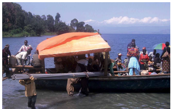
Eraikuntza-materialak txalupan garraiatzen Bukavu hiritik

Ur edangarria eskuratzeko baldintzak hobetzearen ondorio soziala handia izan da. Urarekin lotura duten gaixotasunak izugarri murriztu dira. Koleraren kasuan, proiektua gauzatu baino lehen, batez beste, 12 heriotza eragiten zituen urtean, eta orain 1 edo 2 lagun eragiten die urtean. Emakumeen kasuan, osasun-arloko hobekuntzatik haratago doaz ondorioak: orain ez dute egunero ibilaldi luzerik egin behar ura hartzeko, eta beste jarduerak batzuetan erabil dezakete denbora hori, esaterako, prestakuntzan.