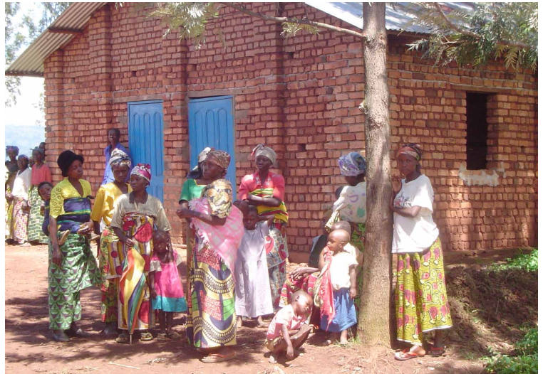
Batzordeetako emakumeak gorabeherei buruz hitz egiteko eta mantentze-lanak koordinatzeko biltzen dira

Bizilagunek aukeratutako hiru lagunek osatzen dute batzorde bakoitza. Pertsona horiek emakumeak izan behar dute. Izan ere, komunitateek uste dute emakumeek hobeto ezagutzen dituztela uraren hornidurarekin eta erabilerarekin zerikusia duten kontuak. Neurri hori genero-berdintasunerako aurrerapausoa da Idjwiko komunitateetan. Pixkanaka-pixkanaka, emakumeak erantzukizun publikoak hartzen hasi dira , bai eta komunitateko kontuetan erabakiak hartzeko orduan modu aktiboan parte hartzen ere, lehen gizonezkoetara mugatuta zegoen eskumenean.