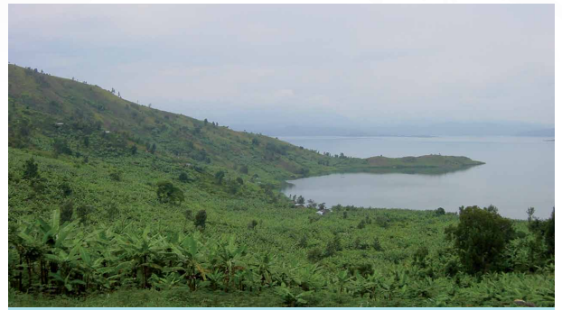
Uharteko erliebe menditsua kostaraino hedatzen da

Lehenik eta behin, uraren inguruan dagoen arazoa, arazo horren kausak eta eragiten zuten faktoreak aztertu ziren, bai eta proiektu bat aurrera eramateko zituzten ahalmenak, giza baliabideak eta baliabide materialak eta teknikoak ere.